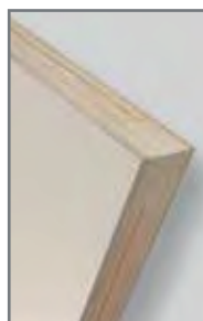
* Largueros y travesaños