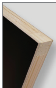
* Largueros y travesaños