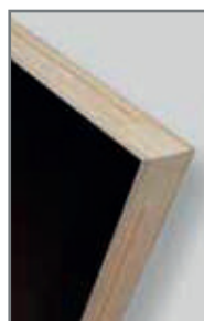
* Largueros y travesaños