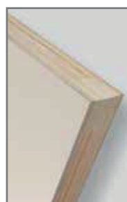
* Largueros y travesaños