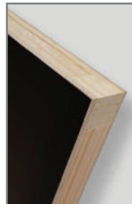
* Largueros y travesaños