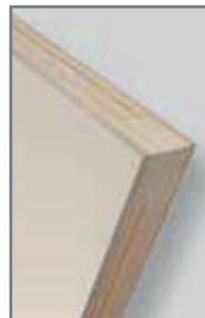
* Largueros y travesaños