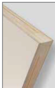
* Largueros y travesaños