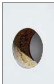
* Chape ro