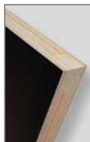
* Largueros y travesaños